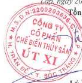
Lý Bích Quyên